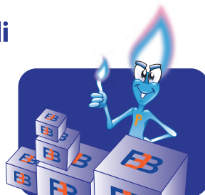
Trattamento per linee piega-incolla