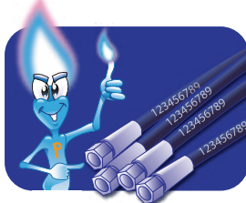
Trattamento per cavi elettrici e speciali